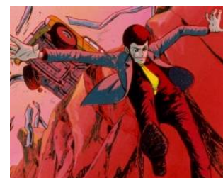
原作：モンキー・パンチ © TMS

俺は天下無敵の大泥棒。最初のアニメはチバテレと同じ 1971年放送スタートなので、チャンネルは決まったぜ！