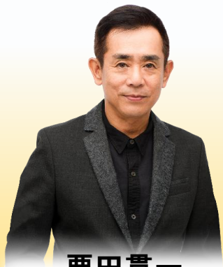
栗田貫一 (ものまねタレント・声優)