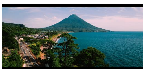
【U-18 最優秀賞】 「鳥が見てる世界in九州」 制作/中元悠仁