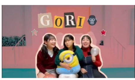
【勝又自動車賞】 「BRAND NEW GIRL」 制作/千葉県立松戸国際高校