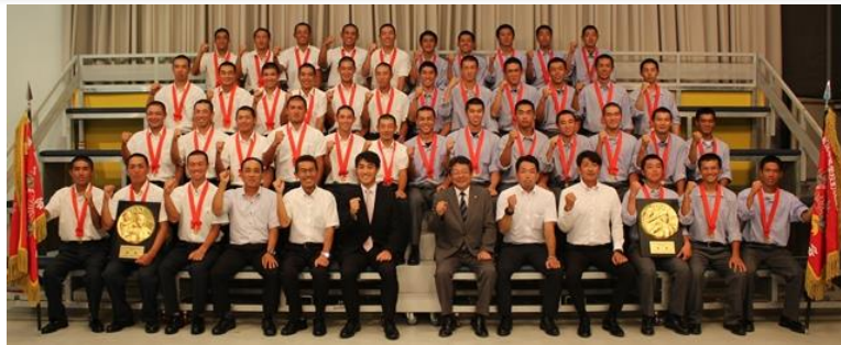
甲子園での活躍を誓った 木更津総合(左)と中央学院(右)